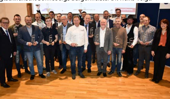
Die geehrten Ausbildungsbetriebe, darunter auch die Chefs der Baufirma STL Sonneberg GmbH und der Autohaus Stenzel GmbH aus Sonneberg.