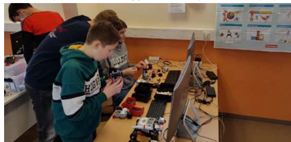
Letzte Änderungen vor dem Halbfinale.