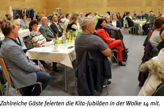
Zahlreiche Gäste feierten die Kita-Jubiläen in der Wolke 14 mit.

Ein ganz besonderer Tag Stadt feierte die Jubiläen für Kindergärten „Spatzennest“ und „Pustebblume“