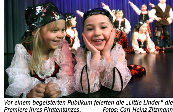
Vor einem begeisterten Publikum feierten die „Little Linder“ die Premiere ihres Piratentanzes.