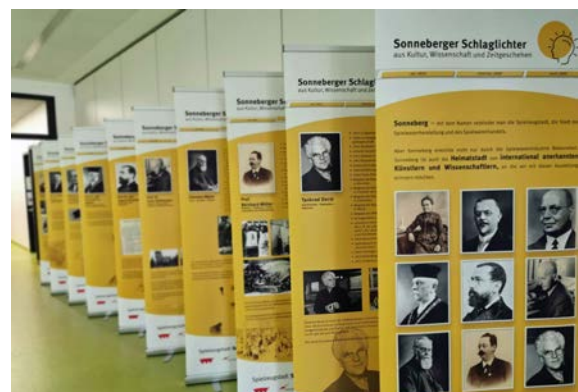
Zehn Roll-Ups mit Sonneberger Persönlichkeiten wurden zur Eröffnung der neuen Ausstellung in der Sibylle-Abel-Schule platziert.