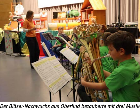
Der Bläser-Nachwuchs aus Oberlind bezauberte mit drei Musikstücken. Flotte Tänze aufs Parkett legten die „Stepping Sisters“ des Jugendzentrums Erholung.