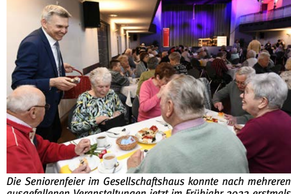
Die Seniorenfeier im Gesellschaftshaus konnte nach mehreren ausgefallenen Veranstaltungen jetzt im Frühjahr 2022 erstmals wieder stattfinden.

Endlich nachgeholt Seniorenachmittag im G-Haus: Mit Musik, Tanz & Humor in den Frühling