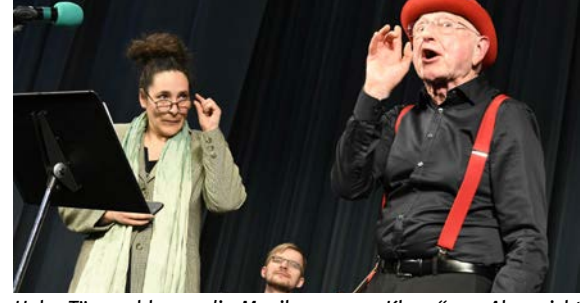
Hohe Töne schlugen die Musiker von „4-Klang“ an. Aber nicht nur musikalisch überzeugte die Gruppe, sondern auch mit Witz und Charme.