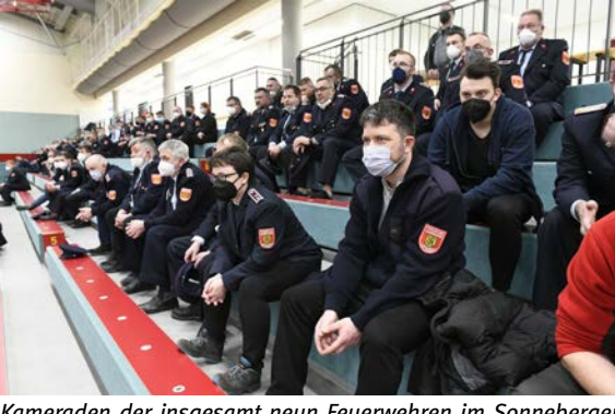
Kameraden der insgesamt neun Feuerwehren im Sonneberger Stadtgebiet sind beim Urnengang für die Wahl eines neuen Stadtbrandmeisters dabei.

Ein ganz besonderer Tag Stadt feierte die Jubiläen für Kindergärten „Spatzennest“ und „Pustebblume“