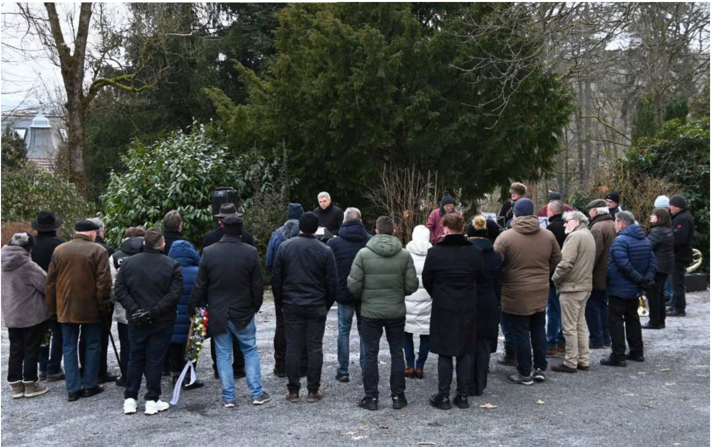
Zu einer Gedenkstunde für die Bombenopfer hatte die Stadt auf den Hauptfriedhof eingeladen.