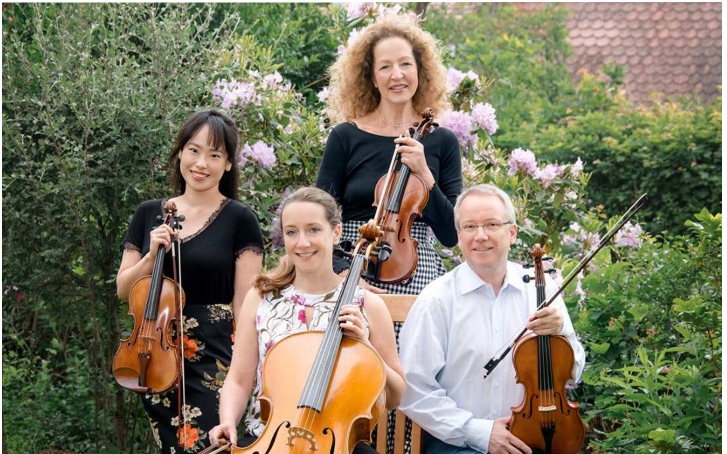
Das Esterhazy-Quartett kommt zum Konzert nach Sonneberg.