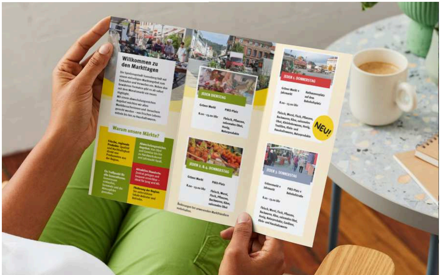
Einen neuen Flyer mit allen Markttagen hat die Stadt Sonneberg aufgelegt.